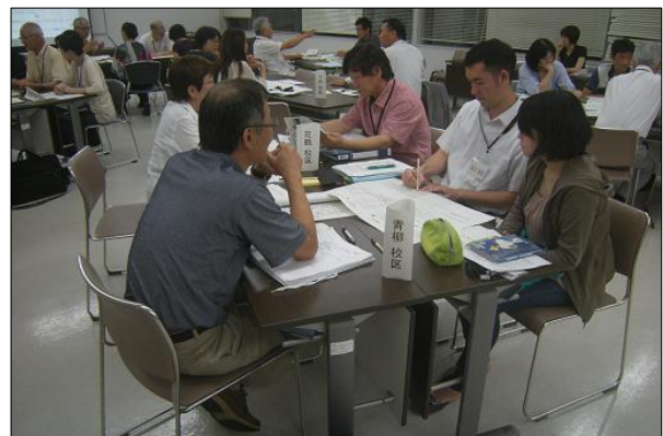
第7回策定委員会の話し合いの様子

策定委員のパワーポイントによる説明を聞いた後、5～6人のグループに分かれ、ワークショップ形式で今後のまちづくりについて意見交換を行います。